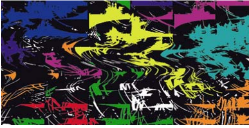
María Elisa Luna

El color es la sensación producida por los rayos luminosos que impresionan los órganos visuales y que depende de la longitud de onda. Con la ayuda de los lentes cromadepth podemos ver la posición que toma cada color en el espacio de una manera tridimensional. De adelante hacia atrás el esquema sigue el espectro de luz visible, del rojo al naranja, amarillo, verde y azul.